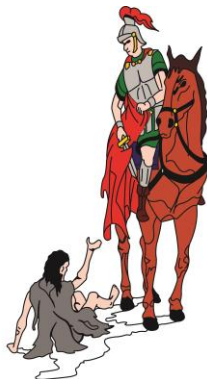
Schutterij Sint Martinus Born